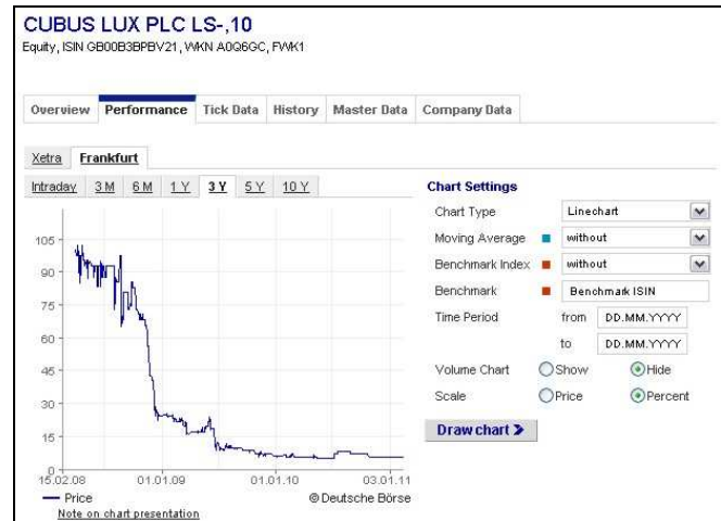
Izveštaj sa berze u Frankfurtu

Pored toga, u svojim finansijskim izvještajima, kompanija Cubus Lux priznaje da nema novac potreban za planirane investicije i izražava nadu da će podršku za projekat dobiti od lokalnih banaka u Crnoj Gori.