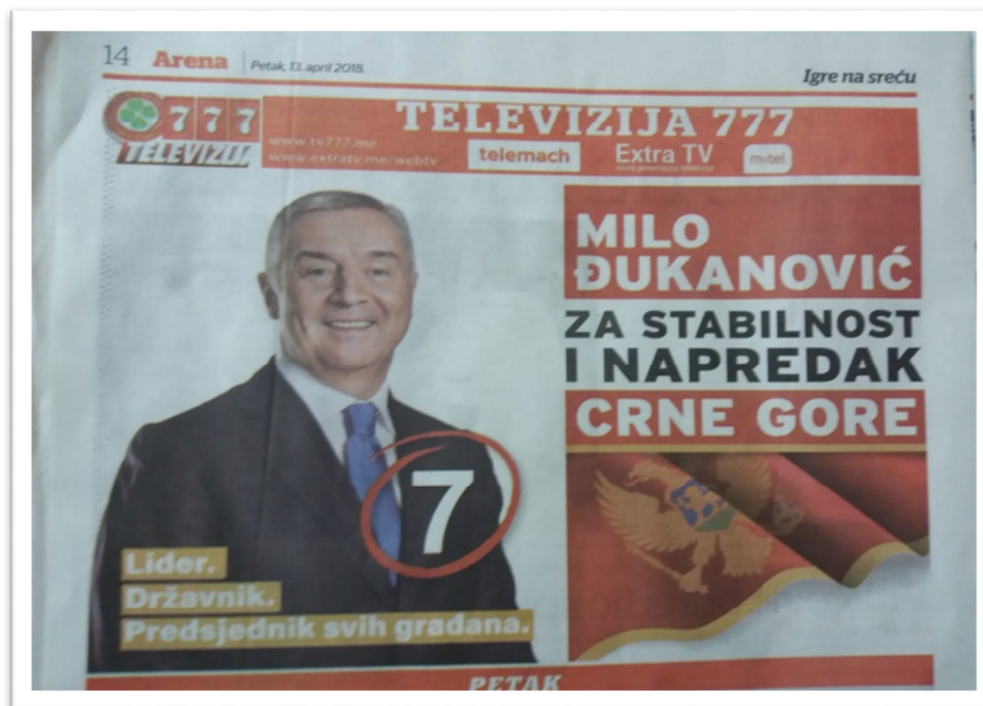
Fotografija 8: Oglašavanje predsjedničkog kandidata Mila Đukanovića u „Areni“, dodatku dnevnog lista „Pobjeda“

Predsjednički kandidat Milo Đukanović je bio reklamiran u „Areni“, dodatku dnevnog lista „Pobjeda“ u čijem cjenovniku koji je dostavljan za predsjedničke izbore nema cijene za oglašavanje u Areni. Tako se može zaključiti da u navedenom dodatku nije postojala mogućnost oglašavanja za druge kandidate već samo za predsjedničkog kandidata Mila Đukanovića, a cijena samog oglašavanja je nepoznata.