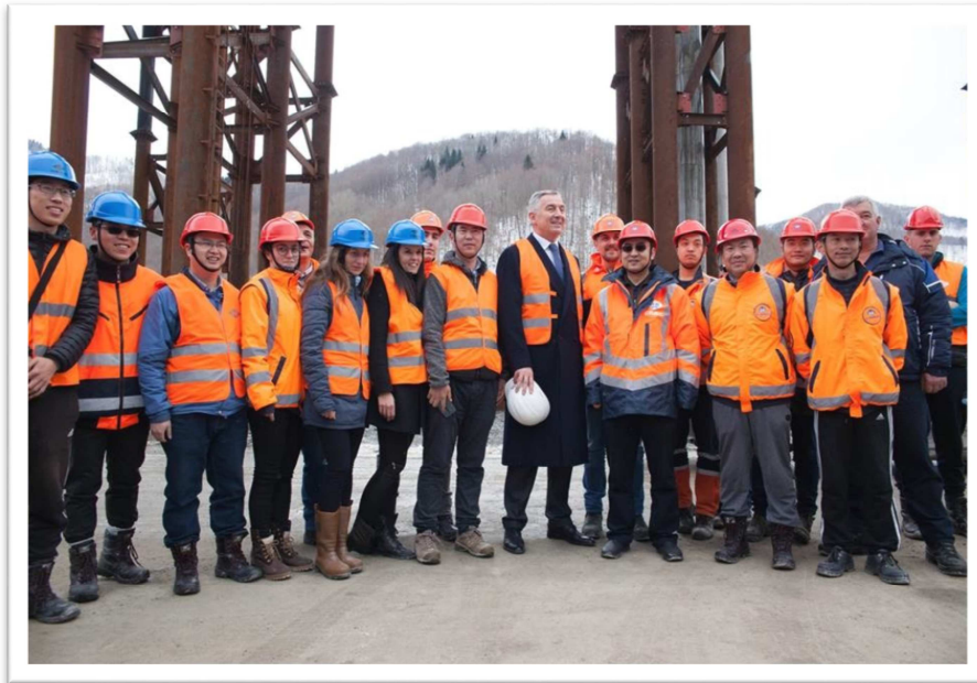
Fotografija br. 3: Kandidat za predsjednika Milo Đukanović u obilasku dionice autoputa Bar-Boljari

Predsjednički kandidat DPS-a, Milo Đukanović je u okviru kampanje za predsjedničke izbore u Kolašinu iskoristio priliku i posjetio gradilište prve dionice autoputa Bar-Boljare. Tom posjetom je razgovarao sa inženjerima i radnicima kompanije “China Raod and Bridge Coorporation” koji izvide radove na jednom od najvećih infrastrukturnih projekata u Crnoj Gori.