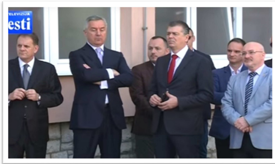
Fotografija 2: Kandidat za predsjednika Milo Đukanović puštanju u rad aparata za magnetnu rezonancu u Kliničkom centru Crne Gore

Samo pet dana prije predsjedničkih izbora, Đukanović je zajedno sa funkcionerima DPS-a prisustvovao svečanom puštanju u rad vrijednog aparata za magnetnu rezonancu u Kliničkom centru Crne Gore. Aparat za magnetnu rezonancu najnovije generacije instaliran je na Odjeljenju za radiološku dijagnostiku, a vrijedan je više od pola miliona, od kojih je 400.000 eura donirao Nikolas Alisa sa poslovnim partnerima iz Ujedinjenih Arapskih Emirata.