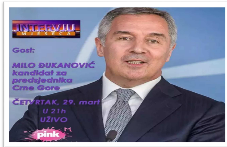
Fotografija 1: Najava gostovanja predsjedničkog kandidata Mila Đukanovića u emisiji „Intervju mjeseca“ na TV Pink

Emisija „Živa istina“ koja se emituje nedeljom od 14 sati na TV Prva i Antena M, emitovana je u vanrednom terminu u srijedu 11. aprila 2018. godine, a gost je bio kandidat za predsjednika Milo Đukanović. Emisija je trajala 98 minuta, što je duže trajanje emisije nego obično.