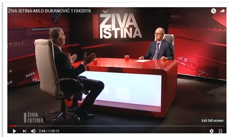
Fotografija 7: Gostovanja predsjedničkog kandidata Mila Đukanovića u emisiji „Živa istina“

Emisija „Živa istina“ koja se emituje nedeljom od 14 sati na TV Prva i Antena M, emitovana je u vanrednom terminu u srijedu 11. aprila 2018. godine, a gost je bio kandidat za predsjednika Milo Đukanović. Emisija je trajala 98 minuta, što je duže trajanje emisije nego obično.