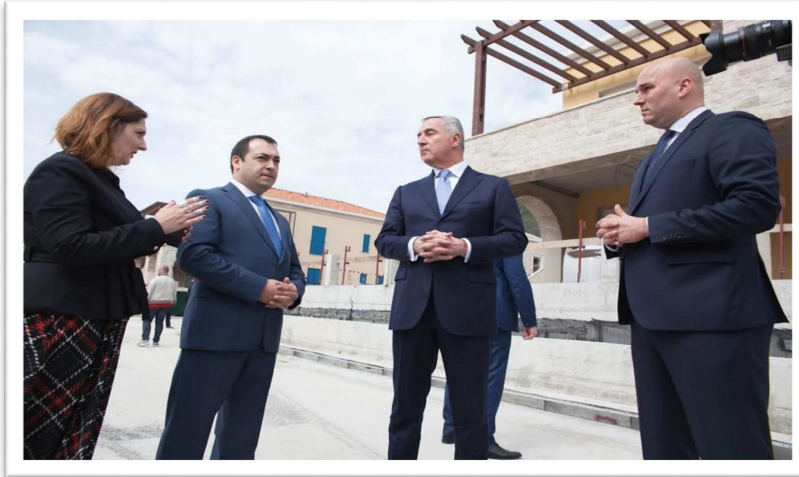
Fotografija br. 4: Kandidat za predsjednika Milo Đukanović u obilasku turističkog rizorta Porto Novi

Đukanović je iskoristio ovu priliku da istakne značaj projekta u razvoju turizma, finansijskog angažovanja značajnih investitora u zemlji kao i povećanja obima zaposlenosti i sveukupnog ekonomskog i društvenog razvoja za koji je zaslužna politika koju je sprovodila izvršna vlast prethodnih godina.