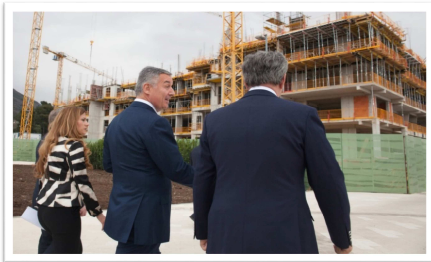
Fotografija br. 6: Kandida za predsjednika Milo Đukanović u obilasku gradilišta u okviru marine “Porto Montenegro”

Prilikom posjete Tivtu, Đukanović je obišao nova gradilišta u okviru marine “Porto Montenegro” i sastao se sa izvršnim direktorom kompanje “Adriatic Marinas” koja je jedna od najboljih marina i nautičkih naselja na Mediteranu. Projekat “Porto Montenegro” je jedan od najvrjednijih brendova turizma i Crne Gore kao države uopšte na međunarodnom planu koji ima cilj za se dalje razvija i u narednih 10 godina, i jedan od najskupljih projekata realizovanih u Crnoj Gori.