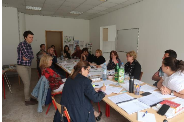
Fotografija br. 2: Sa stručnog okruglog stola održanog 6. juna 2019. godine

Generalni zaključak skupa bio je da je nacrt PUP-a neadekvatan, nepotpun, konfuzan i u cjelosti neprimjenljiv. Mišljenje učesnika bilo je da predloženi plan zadovoljava minimalne standarde struke u metodološkom i sadržajnom smislu, da ne predstavlja razvojni dokument, ne rješava postojeće konflikte u prostoru niti je garant zaštite izuzetne univerzalne vrijednosti Područja Kotora koje se nalazi na UNESCO-voj Listi Svjetske baštine. 4 Zbog svega navedenog, dokument sa opširnim preporukama i sugestijama stručne javnosti dostavljen je MORT-u 11. juna 2019. godine, posljednjeg dana javne rasprave o nacrtu PUP-a. 5