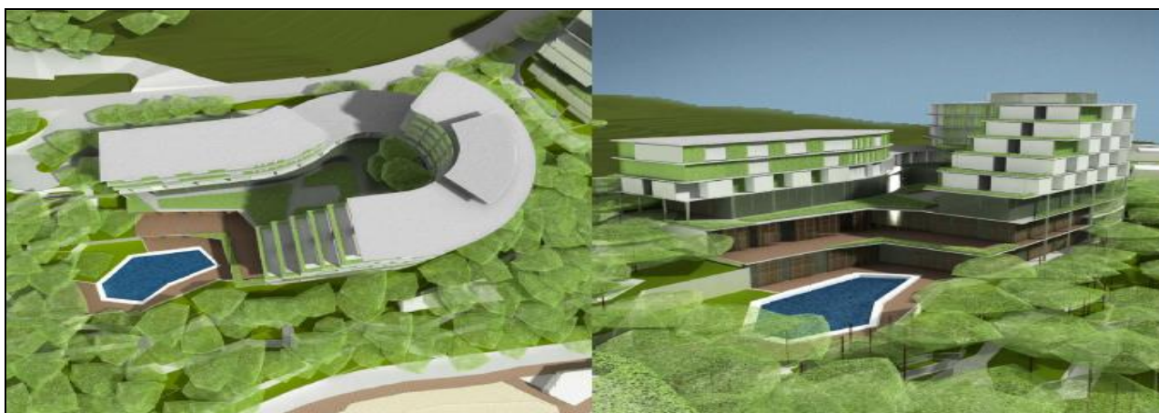
Grafički prikaz br. 16d – Hotel 3D model

39.000 kvadrata za turističke apartmane, 24.000 kvadrata za hotel i 27.000 kvadrata za gradnju bolničkog kompleksa sa sedam spratova. 13