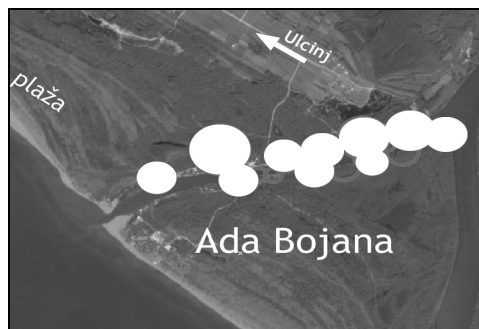
Devastirane zone ušća rijeke Bojane

Prilikom obilaska lokacije, konstatovali smo prisustvo brojnih nelegalnih objekata, uglavnom vikendica, kao i građevinskih mašina koje su, uz samo korito Bojane, krčile i ravnale teren, pripremajući parcele za prodaju. Na više lokacija smo primijetili reklame za prodaju parcele, iako je cijela teritorija u vlasništvu države.