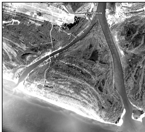
Delta rijeke Bojane i Ada Bojana

Delta rijeke Bojane sa ostrvom Ada Bojana je smještena nadomak Ulcinja, na samom jugu Crne Gore. Ovo područje je proglašeno za prirodni rezervat i zaštićeno nizom zakona i državnih planova kojima je zabranjena bilo kakva građevinarska aktivnost.