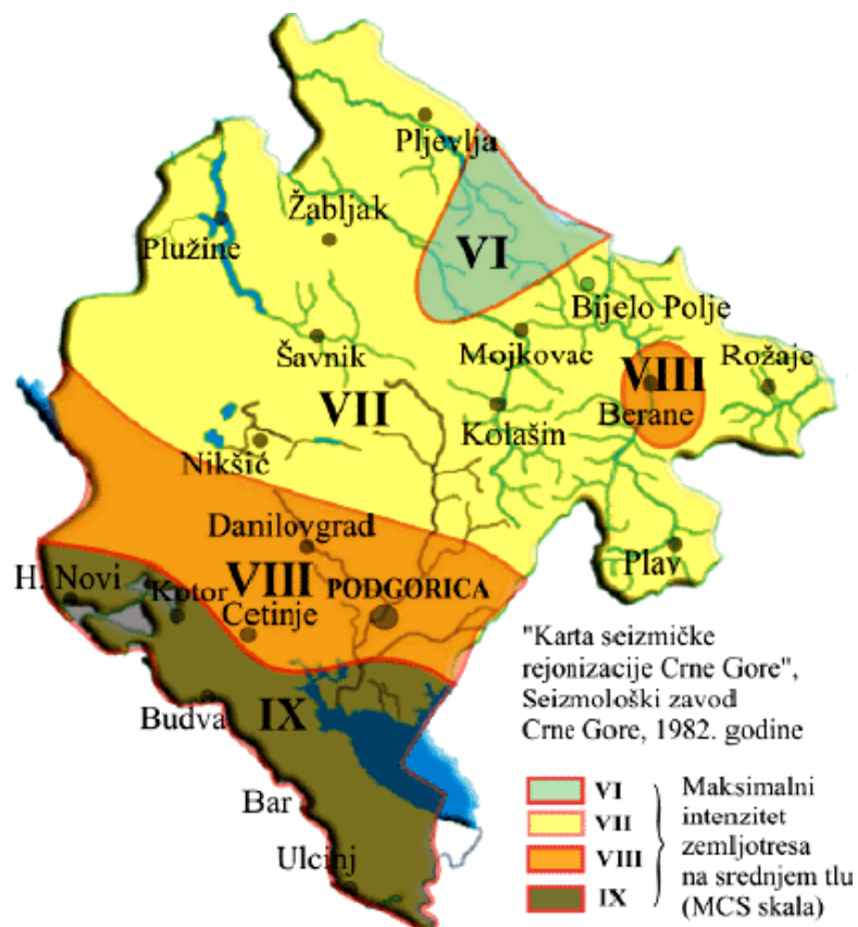
Slika 6. Karta seizmičke rejonizacije Crne Gore

Analizirajući seizmološke karakteristike teritorije opštine Bar, dolazi se do sledećih konstatacija: