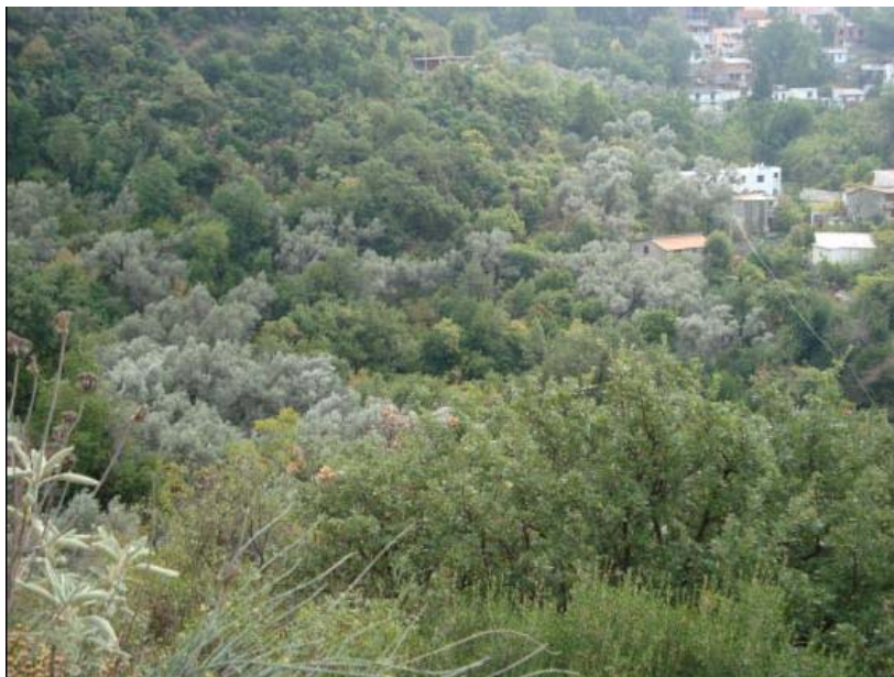
Slika 1. Makija

Opšti koncept pejzažnog uređenja usklađen je sa: