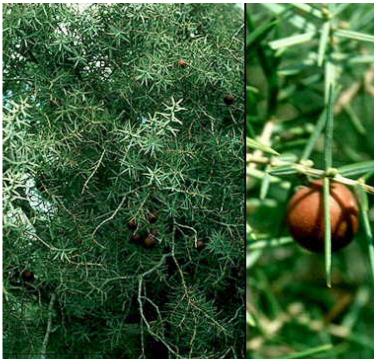
Slika 7. Juniperus oxycedrus L. ( Cupressaceae ) (primorska kleka)

Biljne vrste koje predstavljaju posebne prirodne rijetkosti sreću se na prostoru barske opštine na različitim staništima: Dioscorea Balcanica , Viola specioa , Viola vilensis , Stachys Beskeana , Edrainthus Mettsteini , Asperula Dorfleri , Minuartia Velenovskyi i Galium Baldaoci (sreće se na Rumiji).