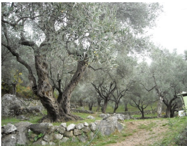
Slika 3. Masline