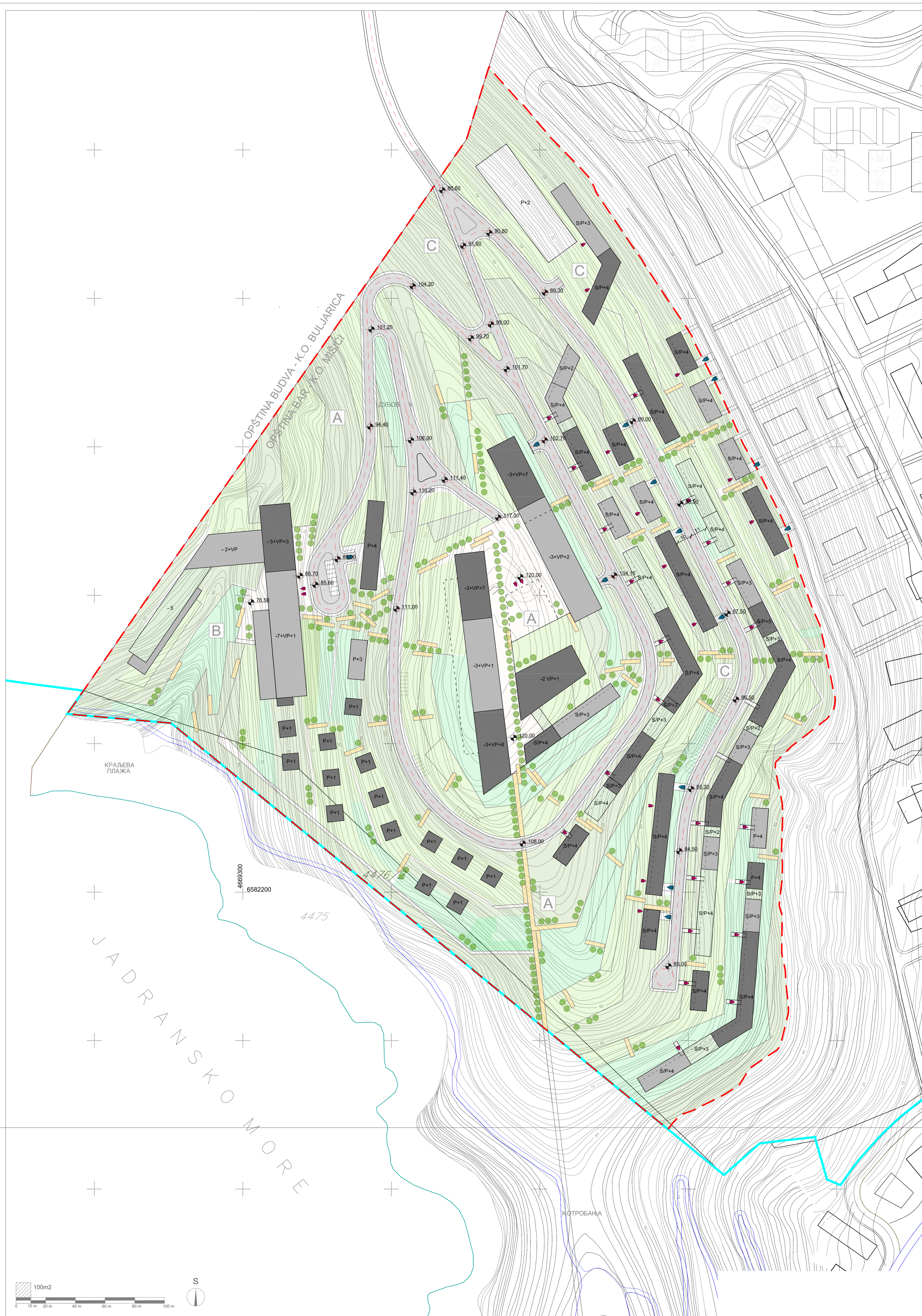
ŠEMATSKI PRIKAZ ZONA