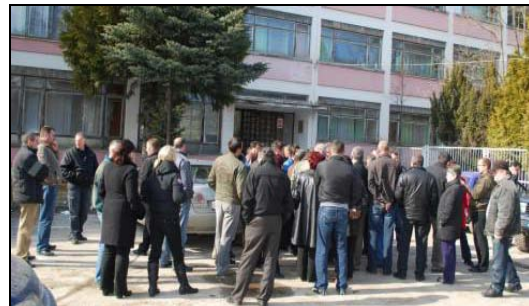
Radnici "Nove Beranke" koji su se bunili 2011. godine

Zbog ovakvog ponašanja Gomilanovića reagovala je inspekcija rada , pečačenjem fabrike u junu 2007. Nije poznato da li su radnici dobili svoja potraživanja, ali nakon ovoga više nisu obraćali javnosti.