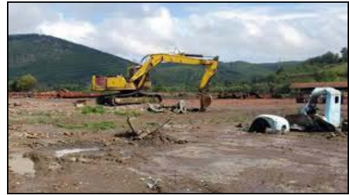
Mjesto na kome se nalazila fabrika "Opeka"

Nije poznato da je iko odgovarao za rušenje fabrike niti da li je istraga i dalje u toku.