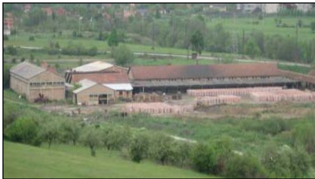
Nekadašnja ciglana "Rudeš"

Novi kupac je bio dužan da o ulaganjima obavještava inspektora koga je angažovala Vlade. Inspektor je bio dužan da svakih šest mjeseci Ministarstvu ekonomije podnosi pisani izvještaj o izvršavanju investicija. To se, pak, nije desilo (više informacija u 2.2.3).