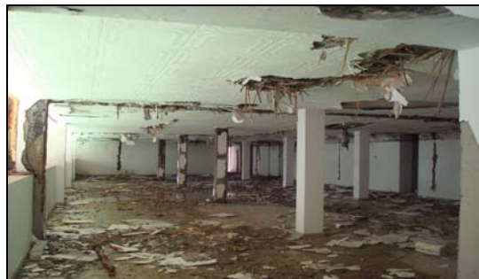
Slika radničkog restorana "Nove Beranke" od oktobra 2013. godine

Na internet registru Uprave za nekretnine nema podataka ko je trenutno u vlasništvu nekretnina "Nove Beranke" 6 .