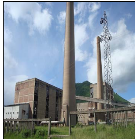
"Nova Beranka", oktobar 2013. godine

Gomilovanoviću je prodato preko 273 hiljade m 2 zemljišta, preko 28 hiljada m 2 pripadajućih objekata kao i pet stanova u Beranama.