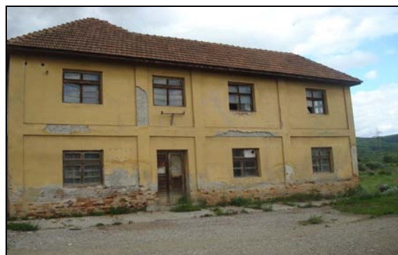
Bivša (srušena) upravna zgrada ciglane

U februaru 2011. godine, stečajni upravnik Radojica Grba je objavio poziv za prvo javno nadmetanje za prodaju "Opeke". Predmet prodaje su bili građevinski objekti sa pripadajućom opremom i infrastrukturom na zemljištu površine preko 49 hiljada metara kvadratnih, kao i mašine, materijal i proizvodi u vlasništvu firme. Početna cijena je bila 1,5 miliona eura ali prodaja nije uspjela. Od tada do ljeta 2012. oglašavano je više poziva za prodaju imovine na kojima je cijena smanjivana.