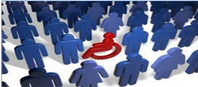
Ilustracija: Zapošljavanje osoba sa invaliditetom veliki problem

I: UVOD: Ustav Crne Gore svakom građaninu garantuje pravo na rad. 1 Studija u nastavku pokazuje kako je Vlada Crne Gore, u periodu od 2009. godine do 2015. godine, osobe sa invaliditetom po osnovu zapošljavanja oštetila za 34,5 miliona eura, koliko je trebalo da bude isplaćeno za profesionalnu rehabilitaciju i zapošljavanje ovih lica.