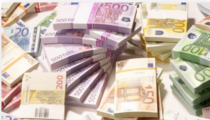
Ilustracija: Uvećanje spornih budžetskih stavki za 9,3 miliona eura

I: Uvod: Predlogom Zakona o budžetu za 2016. godinu Vlada Crne Gore je za 9,3 miliona eura uvećala izdatke pojedinih ministarstava i državnih fondova u odnosu na prethodnu godinu po osnovu više budžetskih stavki, za koje je Istraživački centar MANS ranije utvrdio da se u značajnoj mjeri koriste za izborne zloupotrebe. Riječ je o izdacima koji su planirani za isplatu otpremnina, subvencija, transfera institucijama, opštinama i pojedincima, budžetske rezerve i jednokratne socijalne pomoći.